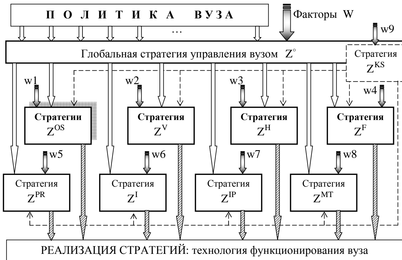
Рис. 1. Схема стратегического управления высшим учебным заведением

Представим рассмотренные стратегии в виде схемы стратегического управления вузом (см. рис. 1).