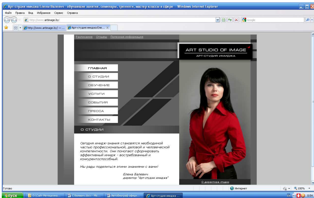
Рис. 2. Главная страница сайта «Арт-студии имиджа»